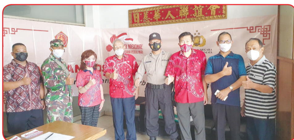
Penyerahan paket cinta kasih kepada warga masyarakat di sekitar kantor sekretariat PSMTI Yogyakarta.

Perwakilan dari Kota Yogyakarta, Kabupaten Gunung Kidul dan Kabupaten Sleman pada Jumat (9/7) lalu menghadiri acara serah