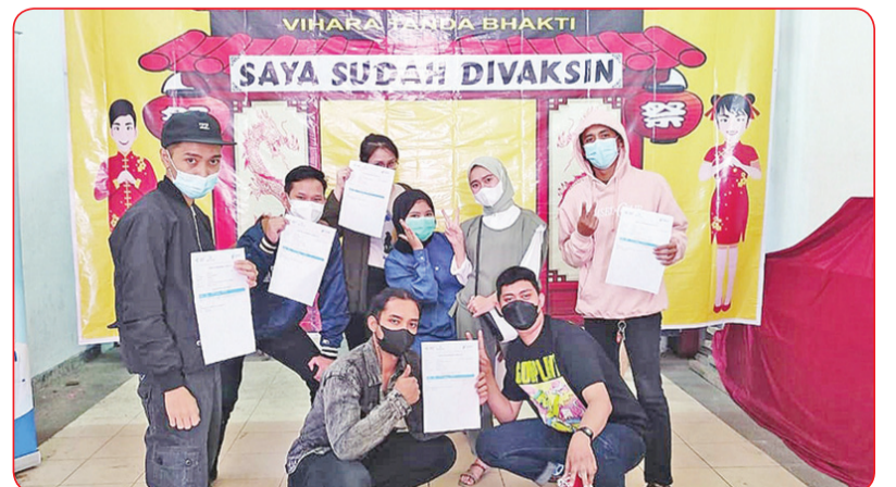
Warga yang sudah menerima vaksin berfoto bersama.