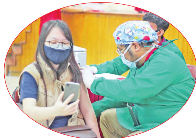
Petugas medis memberikan vaksin ke salah satu peserta vaksinasi.