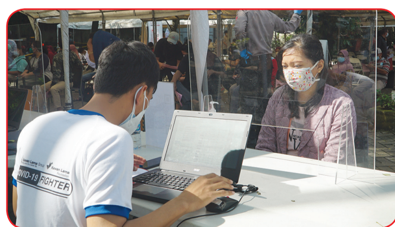
Pendaftaran peserta yang ingin mendapatkan vaksinasi.

"Sebagai bentuk nyata dukungan terhadap program ini, Kawan Lama Group mendirikan Sentra Vaksinasi Covid-19 yang akan melayani masyarakat umum selama satu bulan. Hingga hari ke-7, kegiatan ini berjalan dengan