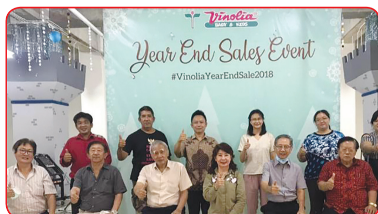
Tim Pendistribusian Paket Cinta Kasih Imlek Nasional 2021 berfoto bersama.

"Sehingga kita dapat merasakan pengalaman 'ringan sama dijinjing, berat sama dipikul' di masa pandemi Covid-19 ini," pungkasnya. • idn/din