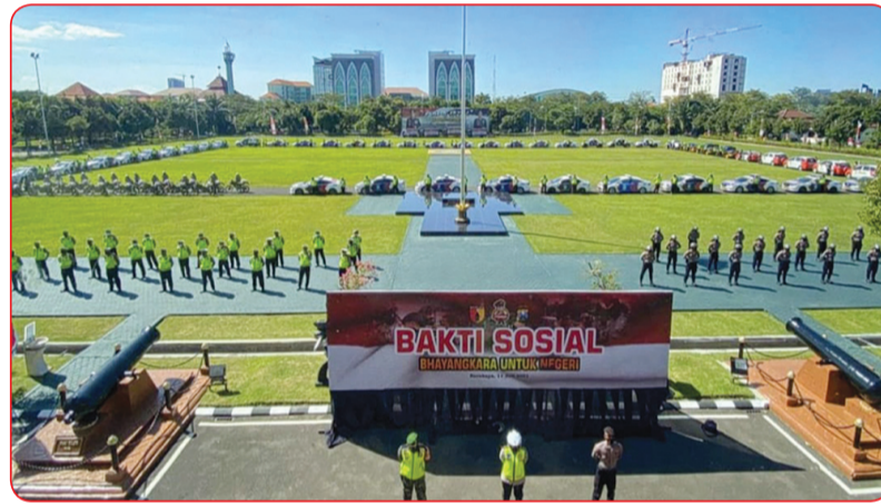
Sejumlah 21 ton beras dan 42 ribu paket sembako didistribusikan secara serentak oleh Polda Jatim, melalui 39 polres/polresta se Jawa Timur.