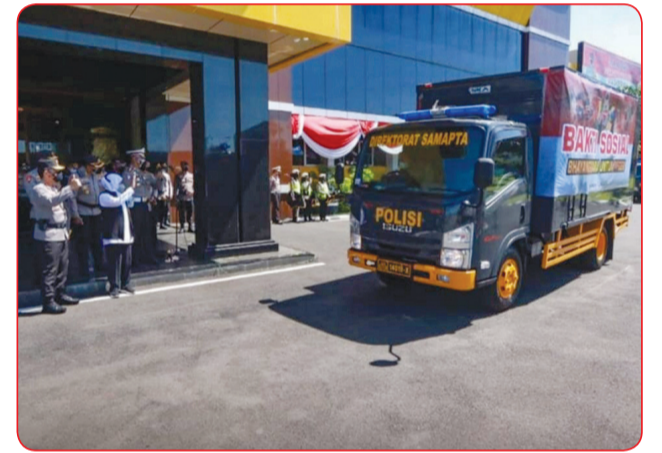
Suasana keberangkatan armada yang membawa sembako untuk dibagikan ke masyarakat.