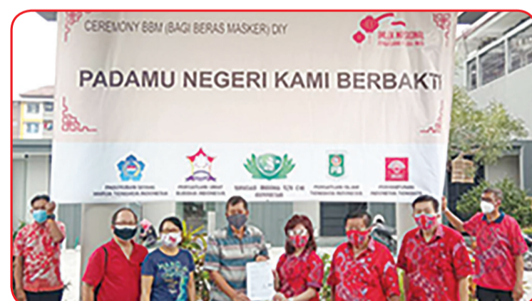
Penyerahan bantuan cinta kasih di gudang pabrik TAMBAK.