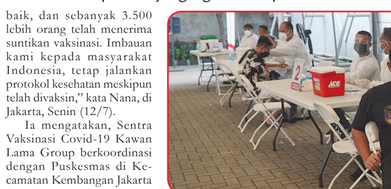
Pelaksanaan program sentra vaksinasi Kawan Lama Group - Dinas kesehatan Jakarta Barat di Gedung Kawan Lama, Jakarta Barat.