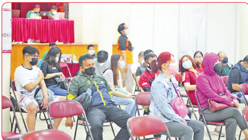
Warga menunggu giliran untuk menerima vaksin.

Menurut instruksi dokter dari Dinas Kesehatan Bandung, warga berusia di atas 18 tahun yang telah divaksinasi dosis pertama akan menerima dosis kedua pada 2 Agustus mendatang. • idn/din