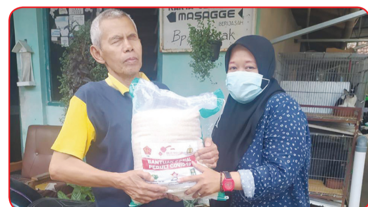
Warga penerima bantuan cinta kasih menerima bantuan dengan penuh rasa haru.